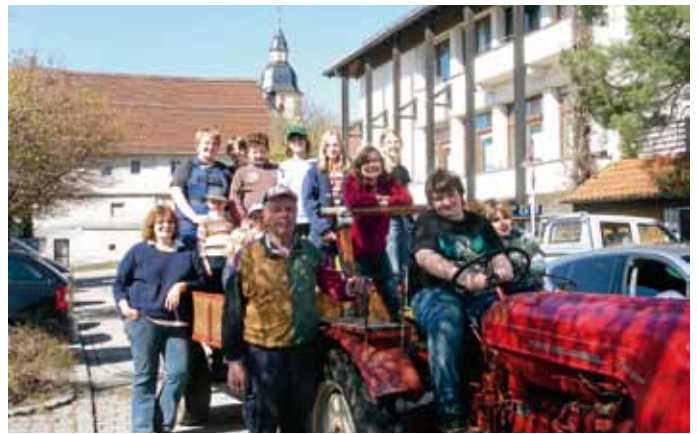
Auf zur Ortsputzete 2013

Liebe Mitbürgerinnen, liebe Mitbürger, auch wenn unser Umweltbewusstsein ständig wächst, gibt es leider immer noch „Unbelehrbare“, die sich nicht um Natur und Umwelt kümmern und achtlos ihren Abfall dort entsorgen, wo es ihnen gerade gefällt. Dabei wäre es doch gerade heute, angesichts einer perfekt organisierten Abfallentsorgung, problemlos möglich, auf derartige Umweltverschmutzungen zu verzichten. Nun müssen alle übrigen Mitbürgerinnen und Mitbürger, die Aktion gegen wilde Müllablagerungsgleichgültigkeit engagiert durchführen. Dies kann jedoch nur gelingen, wenn sich möglichst viele Gruppen, Vereinigungen, Bürger/Bürgerinnen beteiligen.