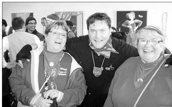
Erinnerung an Horb 2013